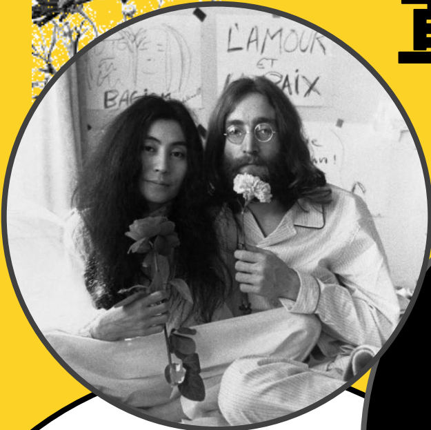
John Lennon & Yoko Ono at Montreal Bed-In 1969.

「ビートルズを解散させた女」 「ドラゴンレディ」とバッシングされ続け、 数十年後、再評価されたオノヨーコと、 欧米での評価を得ることで 日本に返り咲いた草間彌生について、 その生き方と作品を紹介します。 女性がアーティストとして 自己表現を追求し、時代や社会の制約を どのように乗り越えて行ったのか？ その生き方や活動を知り、 新しい視点でアートを観て、 感じてみませんか。